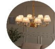
거실조명 Living room lighting